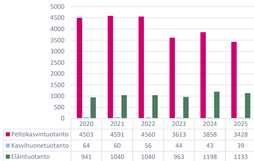
Alkutuotannon tarkastukset yht. 2020 - 2025

■ Peltokasvintuotanto ■ Kasvihuonetuotanto ■ Eläintuotanto