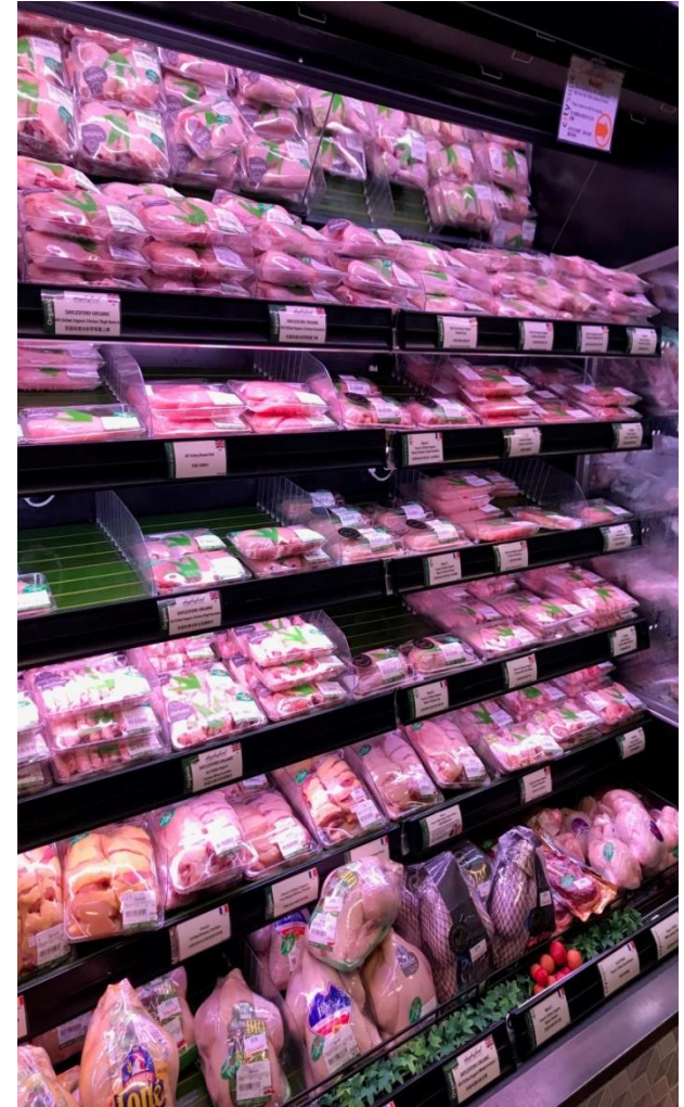
At City Super Hong Kong 40% of all meat and poultry is organic

Market share of L'Uomu Nokka in Hong Kong high end stores 30% but only under 5% of total organic chicken market.